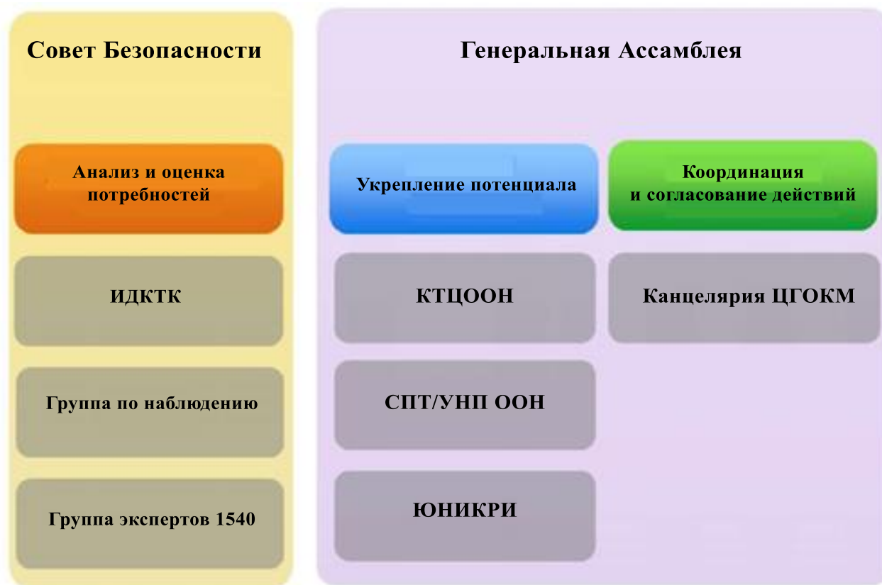
Диаграмма I Главные органы Организации Объединенных Наций по борьбе с терроризмом

Сокращения: Группа экспертов 1540 — Группа экспертов Комитета Совета Безопасности, учрежденного резолюцией 1540 (2004); ИДКТК — Исполнительный директорат Контртеррористического комитета; ЦГОКМ — Целевая группа по осуществлению контртеррористических мероприятий; Группа по наблюдению — Группа по аналитической поддержке и наблюдению за санкциями, учрежденная резолюциями 1526 (2004) и 2253 (2015) Совета Безопасности; СПТ — Сектор по предупреждению терроризма; КТЦООН — Контртеррористический центр Организации Объединенных Наций; ЮНИКРИ — Межрегиональный научно-исследовательский институт Организации Объединенных Наций по вопросам преступности и правосудия; УНП ООН — Управление Организации Объединенных Наций по наркотикам и преступности.