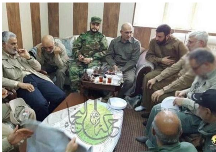
Imagen V El General Soleimani en la “sala de operaciones de Faluya”

foto publicada el 25 de mayo de 2016 con la siguiente leyenda: “Iraqi Harakat Hezbollah al-Nujaba media group published photos of popular forces operations room showing Iran’s Quds Force Commander Major General Qassem Soleimani discussing Faluya battle strategies with Badr commander Hadi Al-‘Amiri, Nujaba’s Akram Al-Ka’abi and another popular fighters’ commander, Abu Mahdi Al-Muhandis”, el General Soleimani se encuentra en la extrema izquierda.