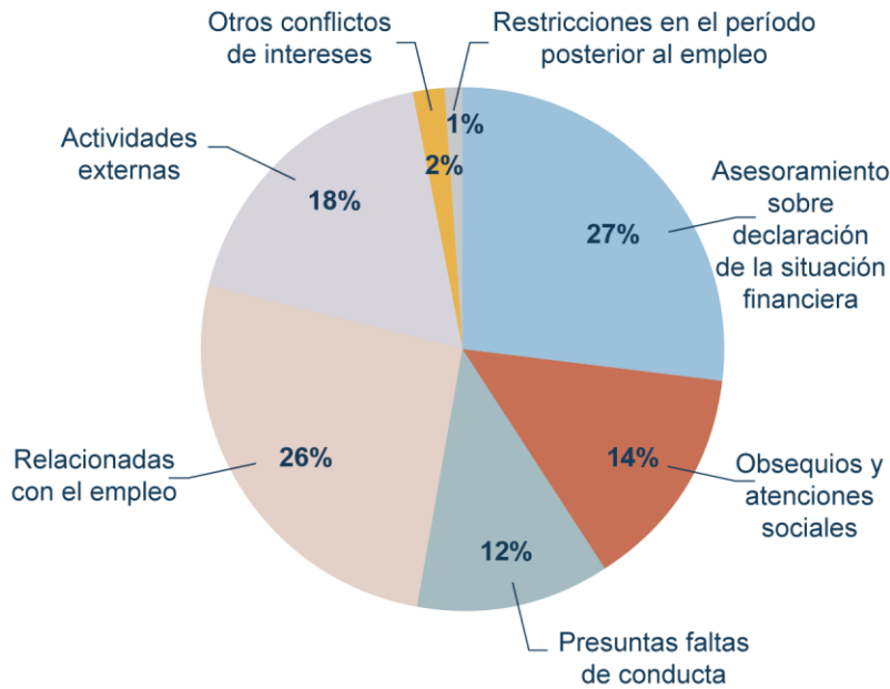
Gráfico 3. Solicitudes de asesoramiento en materia de ética (2015)

21. El asesoramiento y la orientación sobre ética impartidos por la Oficina de Ética en el período de que se informa abarcaron la aclaración o interpretación de normas y reglamentos de la UNOPS sobre actividades prohibidas o restringidas, y, por supuesto, dilemas éticos. Mediante la consulta y la coordinación interinstitucionales con, entre otros, el Consejo Jurídico General y los integrantes del Grupo de Personas y Cambio, el Grupo de Adquisiciones y el Grupo de Auditoría Interna e Investigaciones, la Oficina de Ética ha querido proporcionar apoyo y orientación en materia de políticas en lo que respecta a la interpretación y la aplicación de las normas de la organización.