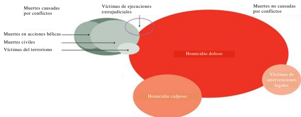
Gráfico II Cómo se informa de la violencia y cómo se registra